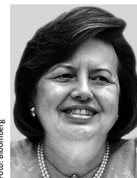
Zeti Akhtar Aziz

Neben den Gründerstaaten Thailand, Indonesien, Malaysia, den Philippinen und Singapur zählt das Sil-